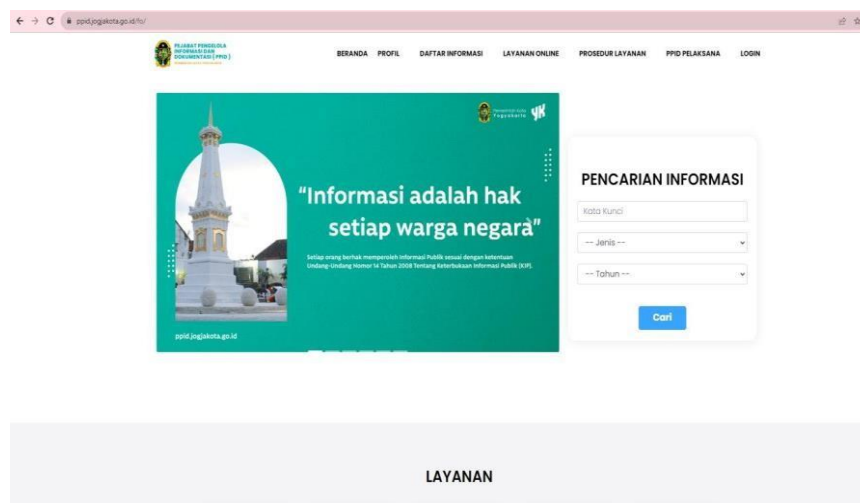
Gambar 2. Tangkapan Layar Sub Domain ppid.jogjakota.go.id

Informasi publik terkait pelaksanaan program kota dan kegiatan Walikota/Wakil Walikota juga dapat diakses melalui aplikasi android Jogja Smart Service dan media sosial Kota Yogyakarta yang dikelola oleh Dinas Komunikasi Informatika dan Persandian Kota Yogyakarta. Saat ini terdapat 5 (lima) platforms media sosial yang digunakan oleh Pemerintah Kota Yogyakarta yaitu Twitter (PemkotJogja), Instagram (@pemkotjogja), Facebook (Dinas Komunikasi Informatika dan Persandian Kota Yogyakarta), Tiktok (PemkotJogja), serta Kanal Youtube YKTV.