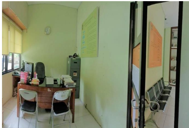
Gambar 3. Fasilitas Pelayanan Informasi Publik di Dinas Komunikasi Informatika dan Persandian Kota Yogyakarta

Selain memberikan pelayanan informasi publik, Pemerintah Kota Yogyakarta juga menyelenggarakan pelayanan permohonan informasi publik. Untuk menunjang pelayanan permohonan ini, telah disediakan sebuah ruangan yang difungsikan secara khusus untuk melayani masyarakat yang datang langsung dan mengajukan permohonan informasi public.