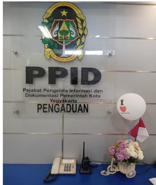
Gambar 2. Ruang pelayanan informasi dan pengaduan di Mal Pelayanan Publik Kompleks Balaikota.

Masyarakat yang hendak menyampaikan pertanyaan terkait Pemerintah Kota Yogyakarta juga dapat mengakses layanan UPIK melalui SMS 08122780001 dan aplikasi Jogja Smart Service yang dapat diunduh melalui ponsel berbasis android. Selain itu masyarakat juga dapat aplikasi SP4N Lapor! yang merupakan aplikasi yang dibentuk oleh Pemerintah Pusat. Permohonan informasi publik yang disampaikan melalui kanal pengaduan dan informasi ini akan diproses sesuai dengan tata cara dan prosedur pelayanan informasi melalui PPID. Secara umum, pelayanan permohonan informasi publik dilaksanakan pada hari kerja (Senin – Kamis 07.30 – 15.30 dan Jumat 07.30 – 14.30 dengan waktu istirahat 12.30 – 13.00). Sementara untuk layanan UPIK dan JSS dapat dimanfaatkan setiap hari.